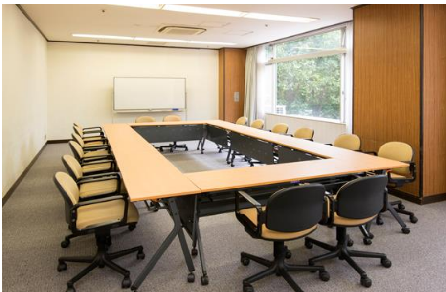
本館内宿泊フロアや飲食施設に至近、各種分科会場にもお勧めです