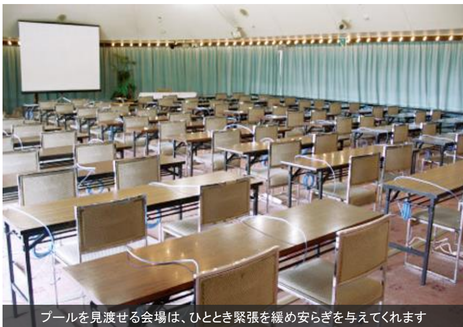
プールを見渡せる会場は、ひととき緊張を緩め安らぎを与えてくれます