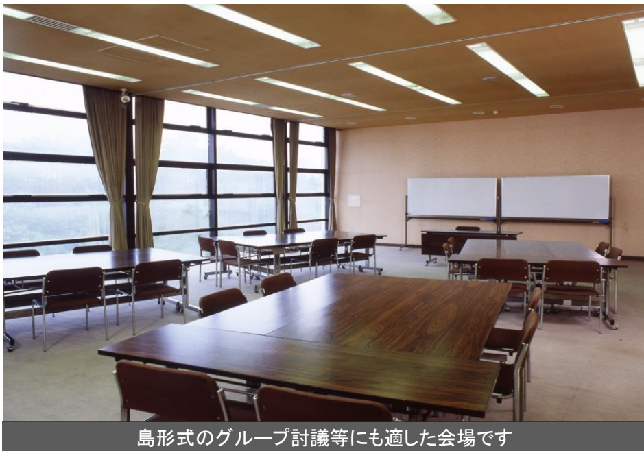
島形式のグループ討議等にも適した会場です