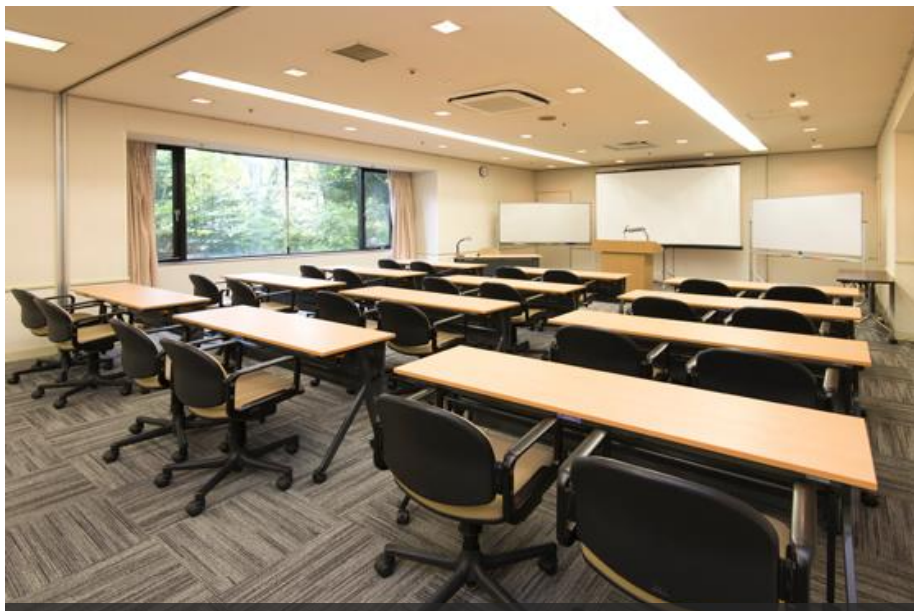
本館内宿泊フロアや飲食施設に至近、各種分科会場にもお勧めです