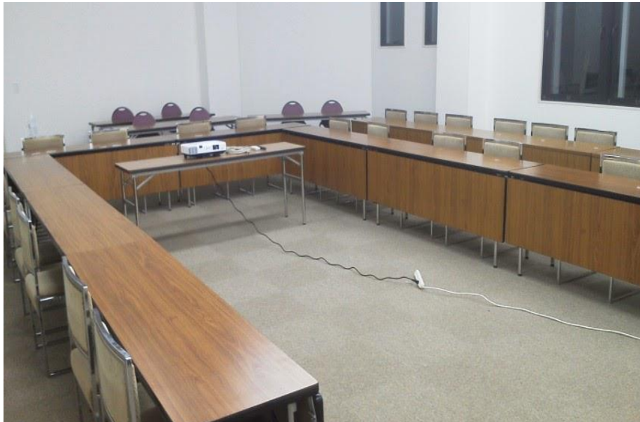
程よい大きさの会議室は、各種分科会場にもお薦めです